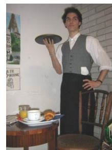
II. helyezett: Párizsi kávéház