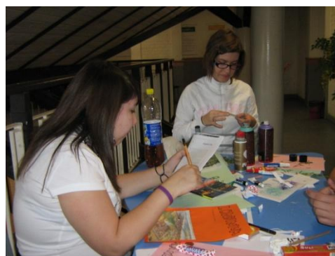
készülnek a 9.ab tablói