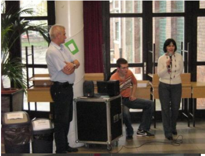
a kiállítás megnyitója