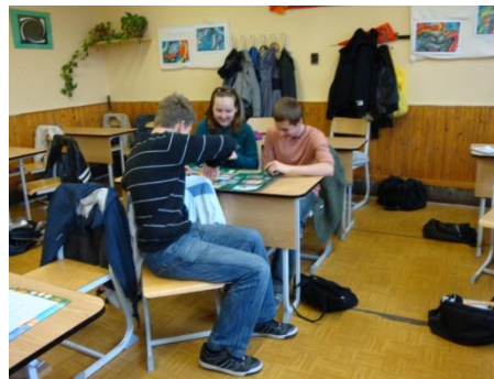
tablókészítés a 8.ab csoportban