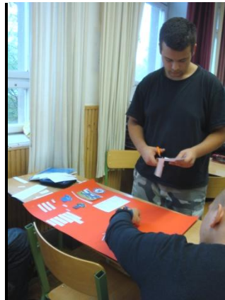
a 11. ab plakátjai készülnek