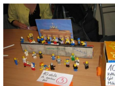
a berlini fal