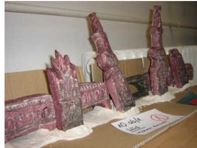
III. helyezett: a berlini híd