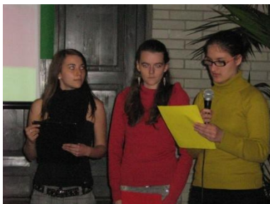
a 10.a csapata és egy kép az előadásukból