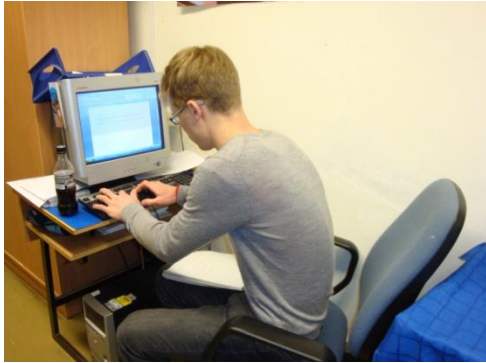
adatgyűjtés a tablókhöz

A közös munkában végül szinte mindenki kivette a részét, a délutáni programokon a csoportot a 11.a osztály tanulói képviselték, míg a 11. b tanulói kirándultak.