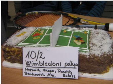
I. helyezett installáció