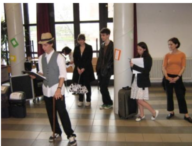
versek a 12.ab előadásában