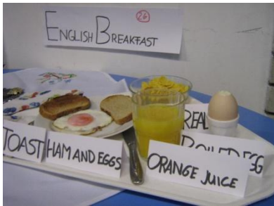
7. ab: Az angolok bőséges reggelije