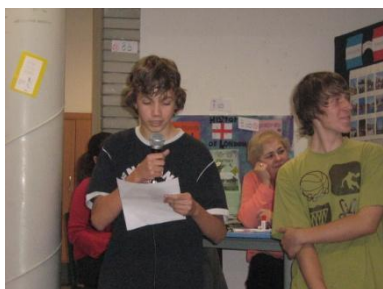
a 8.ab előadói