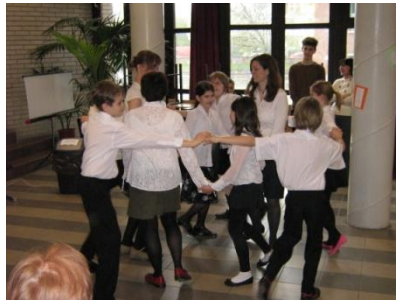
a 4. z és a némettanárok tánca