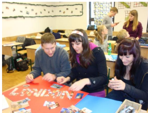
a készülő tablók a 11.ab-ben