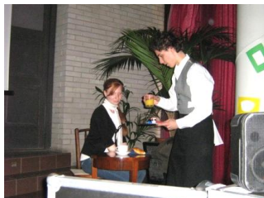
12.b: kávéházi jelenet