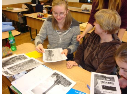
a képek válogatása