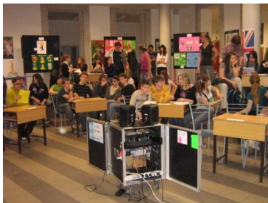
a vetélkedő csapatai