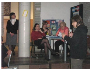
a 7.a előadása