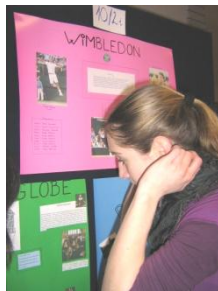
I. helyezett tabló