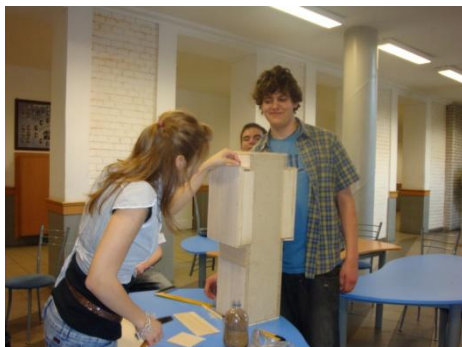
Így készült a berlini opera makettje