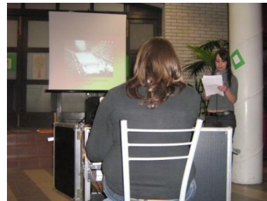
a 9.a prezentációja