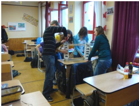
készül a Tower Bridge

Délután a projekt munka bemutatása (4 fő) A témahét zárása (15 fő)