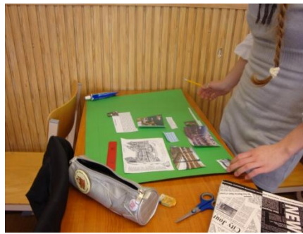
tablókészítés a 10.ab csoportban